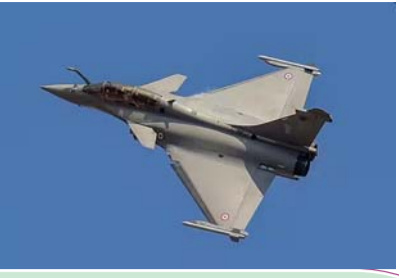
राफेल-भारतीय वायु सेना की पहली पसंद बना पेज-2