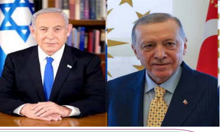
इजरायल का क्या अगला निशाना तुर्की होगा? पेज-2