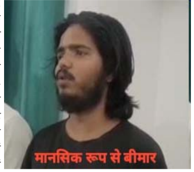
मानसिक रूप से बीमार

न्यूज वाणी ब्यूरो/इटावा, सैफर्ड। न्यूज वाणी दैनिक समाचार पत्र में प्रकाशित खबर का संज्ञान लेते हुए पुलिस ने त्वरित कार्रवाई की और मामले की जांच शुरू की। इसके बाद थाना सैफर्ड में अतिवक्ताओं को बुलाकर पूरे प्रकरण की जानकारी साझा की गई। थाना प्रभारी द्वारा बताया गया कि जिस व्यक्ति द्वारा फेसबुक पर अतिवक्ताओं के लिए रील चलाई गई थी, वह मानसिक रूप से अस्वस्थ है। जानकारी के अनुसार वह पूर्व में एक सड़क दुर्घटना का शिकार हुआ था, जिसमें उसके मस्तिष्क की सर्जरी हुई थी। इसी कारण उसकी सोचने-समझने की क्षमता प्रभावित हो गई है और उसने यह रील अन्य लोगों को कहने पर बना दी थी। मामले में युवक एवं उसके परिजनों द्वारा अपनी गलती स्वीकार करते हुए माफी मांगी गई। अधिवक्ता समाज ने उसकी मानसिक स्थिति को देखते हुए मानवीय ष्टिकोण अपनाया और उसके खिलाफ किसी प्रकार की कानूनी कार्रवाई न करने का निर्णय लिया। पुलिस ने स्पष्ट किया कि खबर के आधार पर आवश्यक कार्रवाई की गई, लेकिन रील चलाने वाले व्यक्ति की मानसिक स्थिति को ध्यान में रखते हुए उसे चेतावनी देकर छोड़ दिया गया। साथ ही उसके परिजनों एवं ग्रामीणों ने भविष्य में ऐसी घटना न होने देने की जिम्मेदारी ली है। इस पूरे प्रकरण में पुलिस की सक्रियता के साथ-साथ सामाजिक संवेदनशीलता भी देखने को मिली।