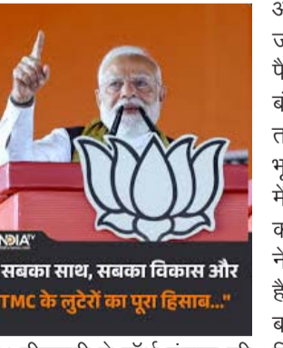
"सबका साथ, सबका विकास और टीएमसी के लुटेरों का पूरा हिसाब..."

जनसभा को संबोधित करते हुए कहा आपको हर बंगाली का दिल जीतना है। मैं कल बंगाल के अलग-अलग क्षेत्रों में गया था और वहां मैंने काफी उत्साह देखा जहां कई बुजुर्ग मीलों तक पैदल चलकर आए थे। इस बार बंगाल से टीएमसी का जाना तय है। मैं आपके प्यार को कभी भूल नहीं सकता हूँ। सिलीगुड़ी में एक जनसभा को संबोधित करते हुए प्रधानमंत्री नरेंद्र मोदी ने कहा, बंगाल कला की धरती है। बहुत सारे आर्टिस्ट दोस्त बहुत बढ़िया पेंटिंग्स लाए हैं। किसी ने मोदी को नेपाली बना दिया है। जो लोग पेंटिंग्स लाए हैं, उनसे मैं अपील करता हूँ, अगर आपका पता पीछे लिखा है, तो मैं आपको थैंक-यू लेटर भेजूंगा। मैं अपने एसपीजी साथियों से कह रहा हूँ कि जो आर्टिस्ट दोस्त ऐसी पेंटिंग्स लाए हैं, कृपया उन्हें ले लें। हालांकि पश्चिम बंगाल में इस लोग भी चुनाव जीतने के लिए ममता बनर्जी की तृणमूल कांग्रेस पूरा जोर लगाए हुए है। जबकि भाजपा भी पूरी ताकत के साथ चुनावी मैदान में है। फिलहाल देखना होगा कि इस चुनाव में बीजेपी या फिर टीएमसी को जनता बहुमत देती है।