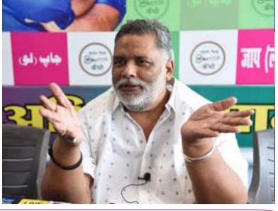
महिलाओं पर पप्पू के विवादास्पद बयान से मचा सियासी तूफान पेज-2