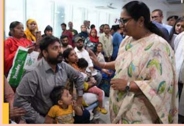
अस्पताल का औचक निरीक्षण किया। इस दौरान सीएम ने अस्पताल की व्यवस्थाओं का जायजा लिया और मरीजों के साथ-साथ उनके परिजनों से

आवश्यक निर्देश दिए। हमारा संकल्प है कि दिल्ली का हर नागरिक ऐसे स्वास्थ्य तंत्र का अनुभव करे जहां समय पर उपचार मिले, आधुनिक सुविधाएं उपलब्ध हों, स्वच्छ वातावरण हो और हर मरीज को सम्मान के साथ सेवा प्राप्त हो। गर्मियों को देखते हुए अस्पताल प्रशासन को दवाइयों की उपलब्धता, पीने के पानी, स्वच्छता, मरीजों की सुविधा और सभी आवश्यक इंतजाम सर्वोच्च प्राथमिकता पर सुनिश्चित करने को कहा गया है। हर परिवार को भरोसेमंद स्वास्थ्य सुझा मिले, हर नागरिक को समय पर उपचार मिले और हर अस्पताल सेवा, संवेदना और विश्वास का केंद्र बने। इसी दिशा में हम निरंतर कार्य कर रहे हैं।