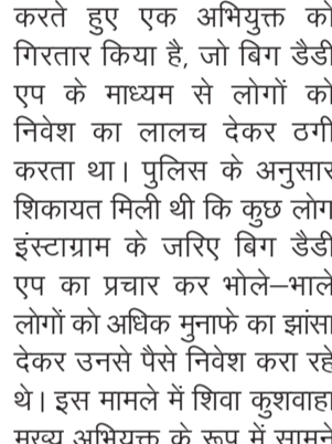
को पुलिस मॉडर्न स्कूल के सामने से गिरफ्तार कर लिया। पूछताछ में अभियुक्त ने बताया कि वह