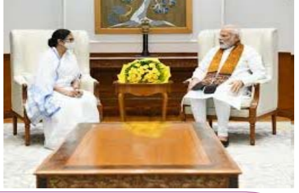
बंगाल का एजिट पोल- ममता की विदाई, भाजपा का खिल सकता है कमल