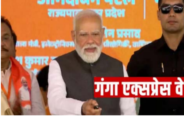
गंगा एक्सप्रेस वे

और एम्बुलेंस की व्यवस्था की गई है। बयान में कहा गया कि एक्सप्रेसवे के किनारे इंटीग्रेटेड मैन्युफैक्चरिंग एंड लॉजिस्टिक्स प्लॉट्स (आईएमएलसी) विकसित किए जा रहे हैं, जिनमें बड़े गोदाम, शीतगृह और खाद्य प्रसंस्करण केंद्र जैसी सुविधाएं निवेश आकर्षित करने और रोजगार सृजन में सहायक होंगी। यह एक्सप्रेसवे पूर्वांचल, आगरा-लखनऊ, बुंदेलखंड और गोरखपुर लिंक एक्सप्रेसवे सहित अन्य प्रमुख कॉरिडोर से भी जुड़ेगा, जिससे एक विशाल अंतरसंपर्क तंत्र तैयार होगा। अधिकारियों ने बताया कि यह परियोजना बड़े पैमाने पर रोजगार के अवसर पैदा करेगी और उत्तर प्रदेश को एक हजार अरब डॉलर की अर्थव्यवस्था बनाने के लक्ष्य में अहम भूमिका निभाएगी।