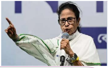
बंगाल-एसआईआर पर विपक्ष के आरोप गलत साबित हुए पेज-2