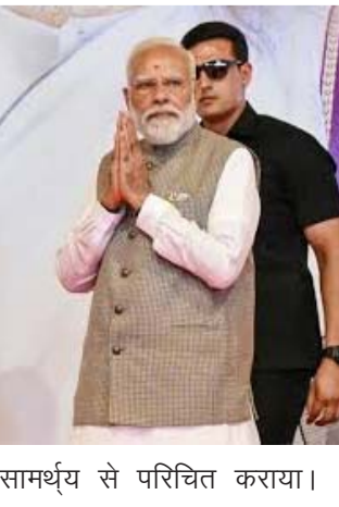
सामर्थ्य से परिचित कराया।

(एजेंसी) नई दिल्ली। प्रधानमंत्री नरेंद्र मोदी ने वैज्ञानिकों को देश के गौरव और स्वाभिमान के सच्चे शिल्पी बताते हुए राष्ट्रीय प्रौद्योगिकी दिवस की शुभकामनाएं दी हैं। प्रधानमंत्री ने 18 वर्ष पहले किए गए परमाणु परीक्षणों को भारत के सामर्थ्य का प्रतीक बताया है। पीएम मोदी ने सोमवार को सोशल मीडिया पर पोस्ट में कहा, वर्ष 1998 में आज के दिन पोखरण में हुए परमाणु परीक्षण ने दुनिया को भारत के अद्भुत