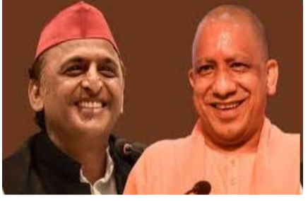
योगी महिमंडल का विस्तार-अखिलेश के "पीडीए" का जवाब