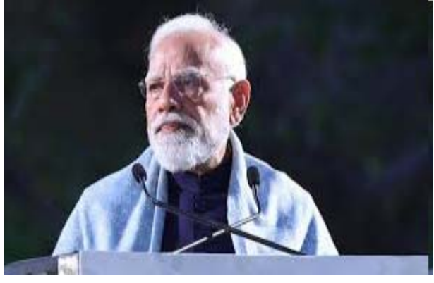
नयी भाजपा (भारतीय जनता पार्टी) सरकार द्वारा आयुष्मान भारत योजना लागू करने के निर्णय का स्वागत किया। उन्होंने कहा कि दो इज्जत वाली सरकार प्रमुख केंद्रीय योजनाओं का निर्बाध कार्यान्वयन करेगी। पश्चिम बंगाल के मुख्यमंत्री शुभेंदु

को आयुष्मान भारत का लाभ मिलेगा। उन्होंने आयुष्मान भारत को विश्व की सबसे बड़ी स्वास्थ्य योजना बताते हुए कहा कि यह उच्च गुणवत्ता वाली एवं किफायती स्वास्थ्य सेवा प्रदान करने वाली योजना है। प्रधानमंत्री ने कहा, साथ ही, दो इज्जत वाली सरकार प्रमुख केंद्रीय योजनाओं का निर्बाध कार्यान्वयन करेगी। अहिंकारी ने कल अपनी पहली कैबिनेट बैठक की अध्यक्षता करने के बाद कहा कि भाजपा सरकार ने छह ऐतिहासिक निर्णय लिए हैं। इनमें पश्चिम बंगाल में आयुष्मान भारत का कार्यान्वयन शामिल है, जिसका उद्देश्य राज्य में असल परिवर्तन लाना है। तुणमूल कांग्रेस को करारी शिकस्त देते हुए भाजपा ने पश्चिम बंगाल में पहली बार सत्ता संभाली है। पार्टी ने 294 सदस्यीय विधानसभा में 207 सीटें जीतकर तुणमूल को 80 सीटों पर समेट दिया।