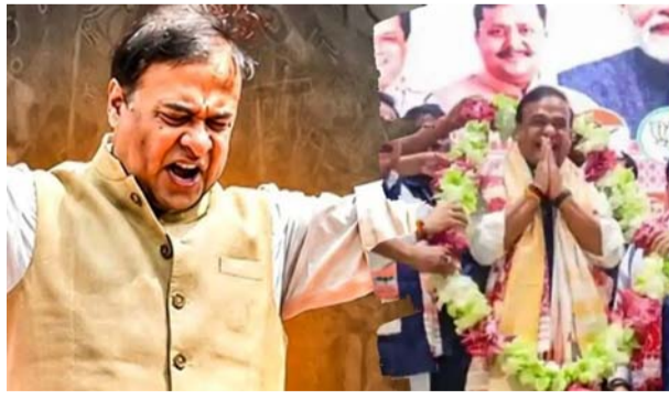
लेकिन बाद में तरुण गोगोई के बेटे गौरव गोगोई के साथ मतभेद बढ़ने के कारण 2015 में उन्होंने कांग्रेस पार्टी छोड़ दी और भाजपा में शामिल हो गए। भाजपा में शामिल होने के बाद उन्होंने सर्बानंद सोनोवाल के साथ मिलकर 2016 में असम में पार्टी की पहली सरकार बनाने में अहम भूमिका निभाई। इसके बाद वित्त, स्वास्थ्य, शिक्षा और लोक निर्माण जैसे महत्वपूर्ण विभाग संभालते हुए उन्होंने 2021 में मुख्यमंत्री पद