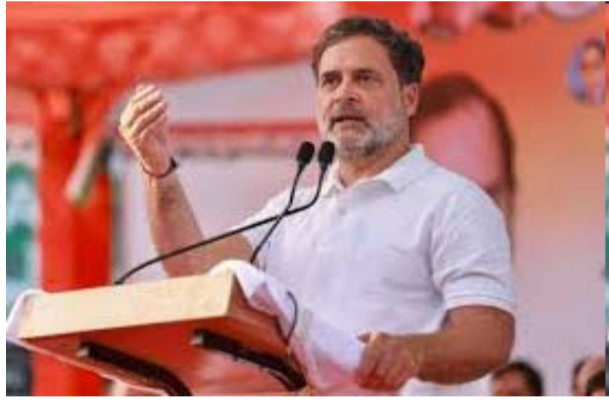
अधिसूचित तिथियों पर पुनः आयोजित की जायेगी। राहुल गांधी ने एक्स पर पोस्ट किया, नीट 2026 की परीक्षा रद्द हो

अनियमितताओं की विस्तृत जांच करने का आदेश दिया। एनटीए ने कहा कि यह परीक्षा अलग से गई। 22 लाख से ज्यादा छात्रों की मेहनत, त्याग और सपनों को इस भ्रष्ट भाजपाई व्यवस्था में मिला- पेपर लीक, सरकारी लापरवाही और शिक्षा में संगठित भ्रष्टाचार। उन्होंने दावा किया कि यह सिर्फ नाकामी नहीं, युवाओं के भविष्य के साथ अपराध है। लोकसभा में नेता प्रतिपक्ष का कहना था, हर बार पेपर माफिया बच निकलते हैं और ईमानदार छात्र सजा भुगतते हैं। अब लाखों छात्र फिर से वही मानसिक तनाव, आर्थिक बोझ और अनिश्चितता झेलेंगे। राहुल गांधी ने कहा, अगर अपनी तकदीर परिश्रम से नहीं, पैसों और पहुंच से तय होगी तो फिर शिक्षा का मतलब क्या रह जाएगा? उन्होंने आरोप लगाया कि प्रधानमंत्री का तथाकथित अमृतकाल, देश के लिए विषकाल बन गया है।