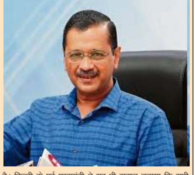
है। दिल्ली के पूर्व मुख्यमंत्री ने यह भी सवाल उठाया कि सभी मितव्ययता उपाय मध्यम वर्ग के लिए ही क्यों हैं और प्रधानमंत्री स्वयं, मंत्री, अधिकारी और देश के अति धनाढ्यों को इस तरह का त्याग क्यों नहीं करना चाहिए? प्रधानमंत्री ने हाल में कई अन्य सुझावों के साथ-साथ लोगों से सोने की खरीद, विदेश यात्रा से बचने और पेट्रोल की खपत को सीमित करने की अपील की थी। विपक्ष ने इन टिप्पणियों को लेकर सतारूढ़ पार्टी पर हमला किया है और इन्हें विफलता का सबूत बताया है।

(एजेंसी) नई दिल्ली। आम आदमी पार्टी (आप) के राष्ट्रीय संयोजक अरविंद केजरीवाल ने मंगलवार को प्रधानमंत्री नरेन्द्र मोदी से उनके द्वारा सुझाए गए मितव्ययता उपायों पर सवाल करते हुए कहा कि उन्हें देश की अर्थव्यवस्था की स्थिति के बारे में जनता को बताना चाहिए। केजरीवाल ने एक संवाददाता सम्मेलन में कहा कि देश ने अतीत में युद्धों सहित कई संकटों का सामना किया है, लेकिन मोदी से पहले किसी भी प्रधानमंत्री ने सात सबसे कड़े कदमों की घोषणा नहीं की और जनता से उनका पालन करने का अनुरोध नहीं किया। उन्होंने यह भी कहा कि मोदी द्वारा सुझाए गए मितव्ययता उपायों के पीछे स्पष्ट कारण अमेरिका और ईरान के बीच का युद्ध है, लेकिन देश की गिरती अर्थव्यवस्था के पीछे कोई और कारण भी हो सकता