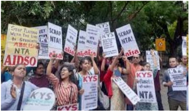
उन्होंने कहा कि वे कौन से बड़े ग्रुप हैं जो इस पेपर लीक में शामिल थे। वहीं अखिल भारतीय विद्यार्थी परिषद (अभाविप) ने नीट-यूजी 2026 परीक्षा से जुड़ी अनियमितताओं, पेपर लीक एवं विश्वसनीयता पर गहन चिंता व्यक्त की है। अभाविप का कहना है कि विभिन्न रिपोर्ट्स में सामने आई जानकारी ने देशभर के