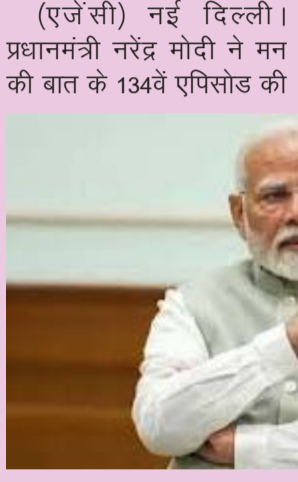
शुरुआत खेल और खिलाड़ियों के शानदार प्रदर्शन से की। उन्होंने देशभर के एथलीट्स की उपलब्धियों की तारीफ करते हुए कहा कि भारतीय