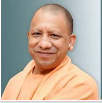
विधानसभा चुनाव 2021- योगी ने अपने मंत्री-विधायकों को दिया बड़ा दसक