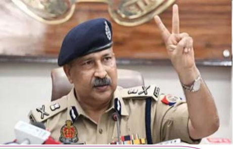
इंतजार खत्म-सूबे का मिला नया स्थायी पुलिस महानिदेशक