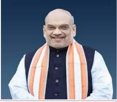
मिशन बंगाल सफल, अब माजपा का मिशन पंजाब होगा शुभ