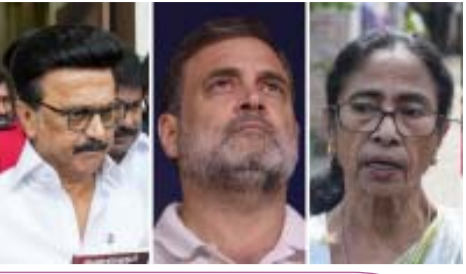
डीएमके और टीएमसी की हार से कांग्रेस खुश न हो पेज-2